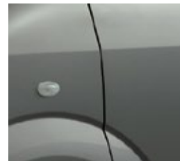
GRIS OSCURO ZDL