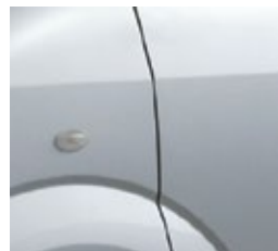
PLATA METÁLICO Z2S